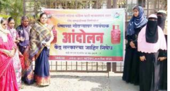
आंदोलन करताना राष्ट्रवादी महिला काँग्रेसच्या वतीने 'चूल पेटवा' आंदोलन करून केंद्र सरकारचे लक्ष वेधले होते. पण केंद्राच्या वतीने त्याची दखल घेतली नसल्यामुळे महिला वर्गात प्रचंड नाराजी आहे.

सरकारचे लक्ष वेधण्यासाठी यापूर्वीच राष्ट्रवादी महिला काँग्रेसच्या वतीने 'चूल पेटवा' आंदोलन करून केंद्र सरकारचे लक्ष वेधले होते. पण केंद्राच्या वतीने त्याची दखल घेतली नसल्यामुळे महिला वर्गात प्रचंड नाराजी आहे. सर्वसामान्यांना महागाईने मोठी झळ बसत आहे. गॅसच्या किंमतीत मोठी वाढ झाली त्यामुळे सर्वसामान्य या महागाई भरडला जात आहे.