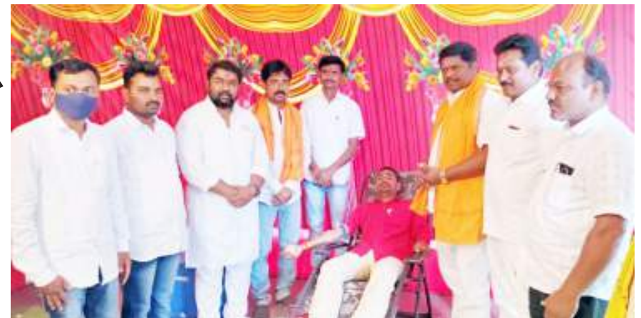
माजलगावात शिबिराला मोठा प्रतिसाद