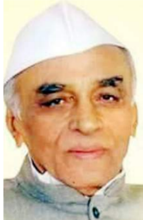
तेलगाव येथील सहकारी साखर कारखाने उभारून ऊसतोड कामगारांचा जिल्हा म्हणून ओळखल्या जाणाऱ्या जिल्हाची बागायतदारांचा जिल्हा म्हणून ओळख निर्माण केली. हरितक्रांती सोबतच दुग्ध प्रकल्पाच्या माध्यमातून धवलक्रांती ही घडून आणली. त्याचबरोबर बीड जिल्हातील

सहकार चळवळ गतीमान केली. मराठवाडा शिक्षण प्रसारक मंडळाच्या अध्यक्षपदाची धुरा सांभाळताना त्यांनी शिक्षणाची गंगा ग्रामीण भागातील सर्वसामान्य जनतेपर्यंत पोहचवावी म्हणून बीड, गेवराई, माजलगाव आणि किल्लेधारूर येथे महाविद्यालय स्थापन केली नव्हे तर शेतकऱ्यांच्या शिक्षित मुलांना मोफत नोकरी लावून दिली. यामुळे नोकरी लावून देणारे साहेब म्हणून त्यांची ख्याती सर्वत्र झाली. लोक त्यांना आपुलकीने 'आप्पा' म्हणत.